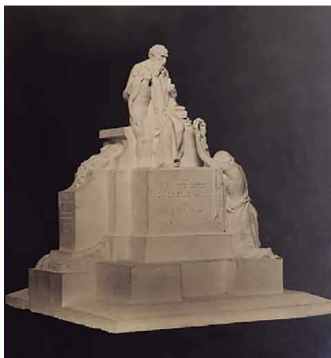
Fotografía del boceto mandado por el Sr. Borrás. 6 de agosto, 1928.

Al fin se firma el contrato el 5 de septiembre de 1928, donde se dan seis meses de plazo para la conclusión del monumento, el precio final será de 35.000 Ptas. libre de gastos y puesto en su emplazamiento. El coste se abonará en tres plazos de 11.666,65 Ptas. el primero a la firma del contrato, el segundo el día en que esté modelado y vaciado el monumento y en condiciones de ser pasado a materia definitiva. El último plazo se hará al quedar colocado en el lugar de su emplazamiento.