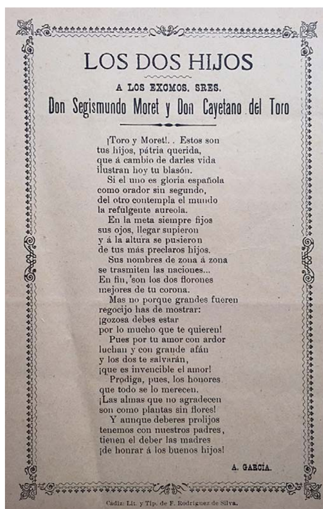
Impreso laudatorio (Ca. 1906-1910)