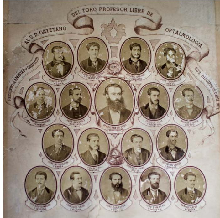
(Orla en obsequio al Dr del Toro por sus alumnos de oftalmología – 1871.) 24