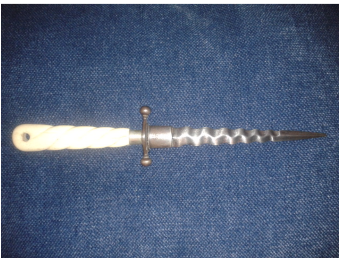
(Daga Masónica de la Logia “Foi et Abnegation nº 241”.)