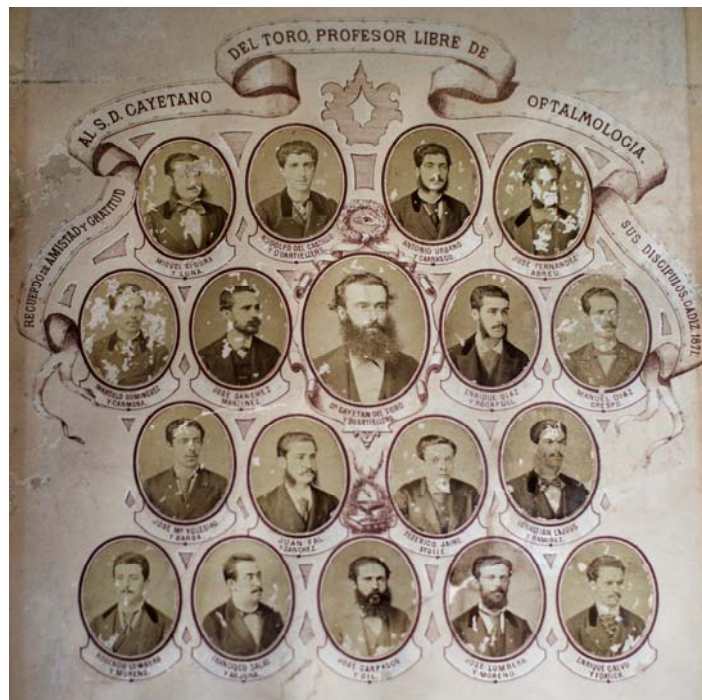
(Orla en obsequio al Dr del Toro por sus alumnos de oftalmología – 1871. Fotografía Rosa Candón López) 24